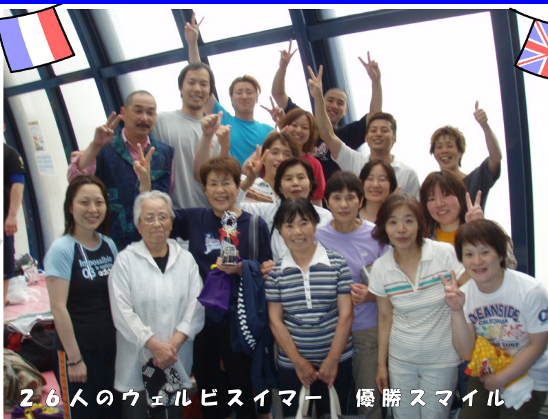
26人のウェルビスイマー 優勝スマイル