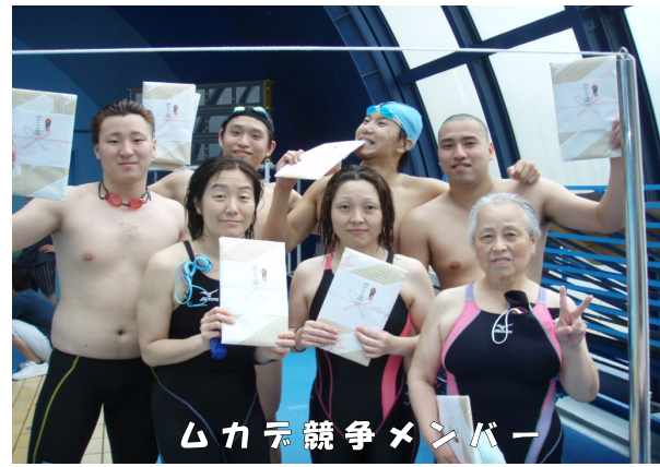
ムカデ競争メンバー

とにかく今年の琵琶湖マスターズ大会は例年以上に盛り上がりました。今まで一回戦負けだった綱引きで勝ち進んで優勝までいった時には応援の皆さんの身体も疲れきって声もかすれていました。これこそ全員が勝ちとった勝利でした。選手の皆さん本当にお疲れ様でした。